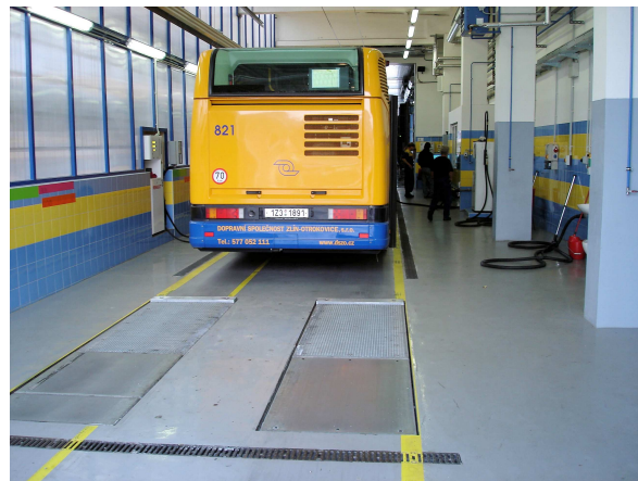
AREX LKW2PSW – zkušebny brzd s testerem sbíhavosti a integrální přejezdovou váhou (Plzeň, Zlín)