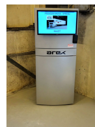
Umístění zkušebny na podlaze